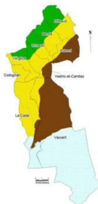
Cultures dominantes dans la plaine du Vistre de nos jours

Conception : RIBES D. Mai 2008