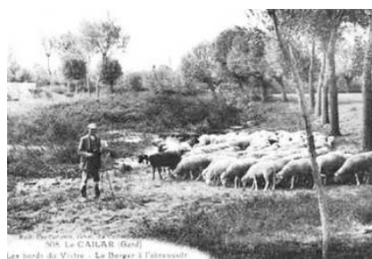
Berger au bord du Vistre, Le Cailar. Elevage extensif typique avant l'assainissement des terres

La création d'un réseau dense de fossés (notamment de fossés profonds drainant la partie superficielle de la nappe) favorise l'extension des terres arables sur les zones humides