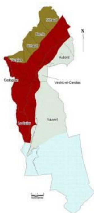
Cultures dominantes dans la plaine du Vistre au XIX ème siècle

Dans les années 1960, le développement de l'irrigation par la Compagnie BRL permet l'implantation des vergers et du maraîchage sur les pentes caillouteuses des Costières, génératrices de ruissellements, tandis que la polyculture revient dans la plaine inondable.