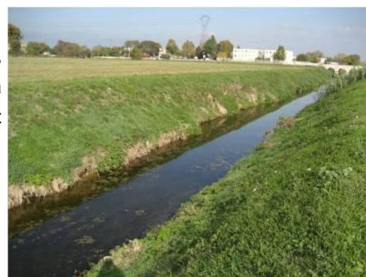
Le Vistre à Caissargues.

1993-1995 : curage du Vieux Vistre au Cailar.