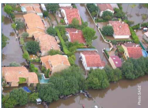
Des ressources et des milieux fragiles